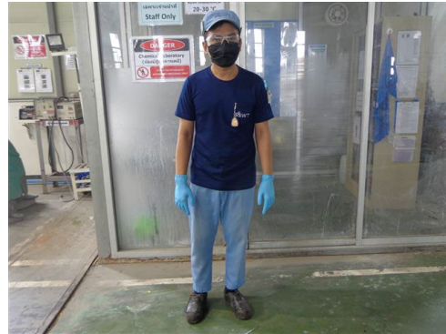
ภาพที่ 2-50 พนักงานสวมใส่อุปกรณ์คุ้มครองความปลอดภัย ส่วนบุคคลขณะปฏิบัติงานหรือสัมผัสสารเคมี