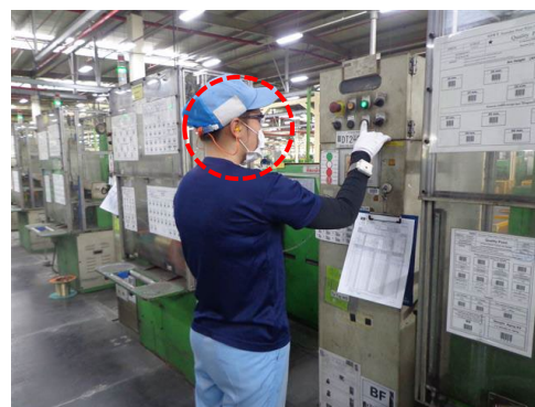
ภาพที่ 2-48 พนักงานสวมใส่อุปกรณ์คุ้มครองความปลอดภัยต่อการได้ยิน