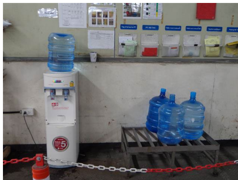
ภาพที่ 2-42 น้ำดื่มสำหรับคนงาน