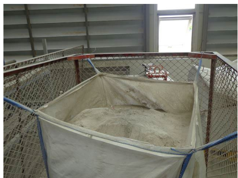
ภาพที่ 2-21 ผงสับที่ใช้งานแล้ว