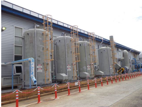
ภาพที่ 2-25 ถังรวบรวมกรดกำมะถันเสื่อมสภาพ