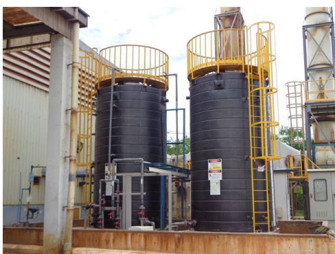
ภาพที่ 2-23 ถังรวบรวมกรดเกลือเสื่อมสภาพ