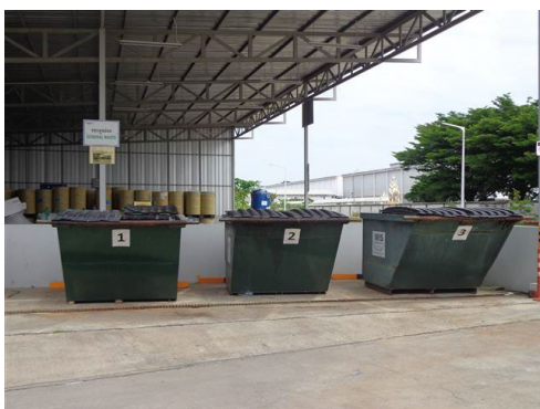
ภาพที่ 2-19 ถังขยะรองรับเศษอาหารจากโรงอาหาร