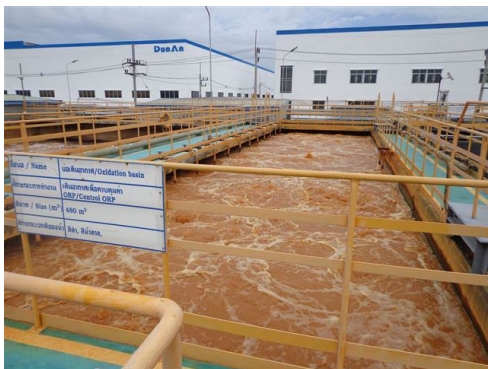
ภาพที่ 2-5 ระบบบำบัดน้ำเสียของโครงการ