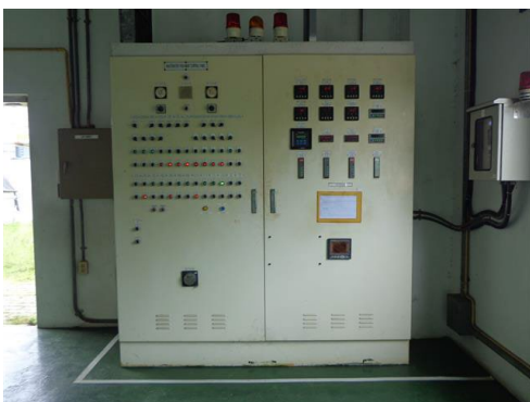
ภาพที่ 2-7 เครื่องตรวจวัด pH และ TDS Online