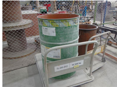
ภาพที่ 2-26 ภาชนะปนเปื้อนสารเคมี (ถังสูญ)