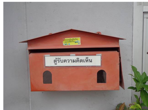
ภาพที่ 2-30 ตู้รับเรื่องร้องเรียน