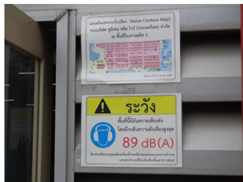
ภาพที่ 2-4 ป้ายเตือนพื้นที่ที่มีเสียงดัง