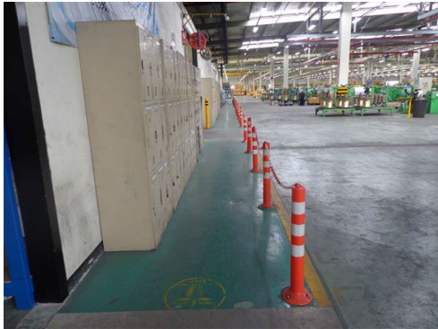
ภาพที่ 2-49 ทางเดินพนักงาน