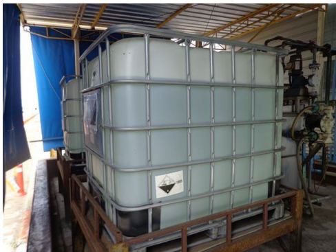
ภาพที่ 2-27 ภาชนะปนเปื้อนสารเคมี (ถังไนตริก)