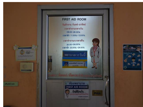
ภาพที่ 2-36 ห้องปฐมพยาบาล