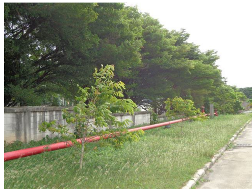
ภาพที่ 2-58 ต้นไม้ยืนต้นเพื่อเป็นแนวกันชน (Buffer Zone)