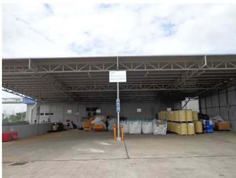
ภาพที่ 2-17 พื้นที่เก็บรวบรวมขยะ