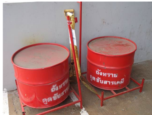
ภาพที่ 2-52 วัสดุดูดซับสารเคมี