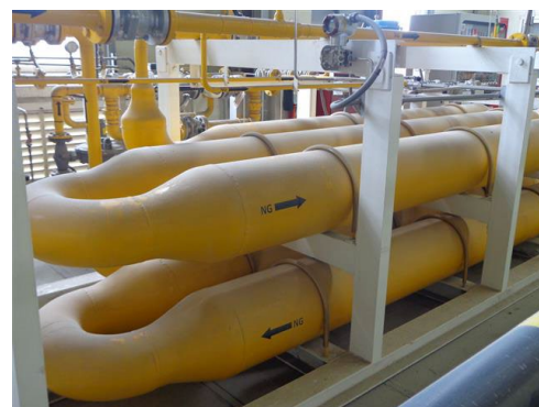
ภาพที่ 2-54 ข้อความแสดงทิศทางการหมุนวาล์ว