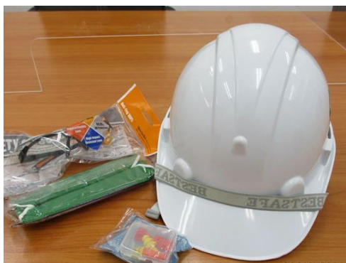
ภาพที่ 2-3 อุปกรณ์คุ้มครองความปลอดภัยส่วนบุคคล