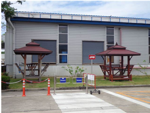
ภาพที่ 2-33 พื้นที่สำหรับพักผ่อน