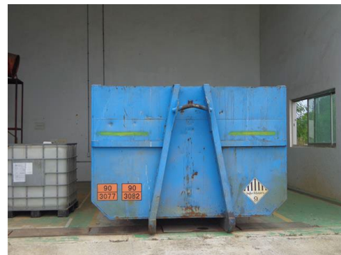
ภาพที่ 2-22 ถังเก็บรวบรวมกากตะกอน