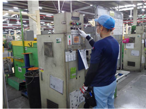
ภาพที่ 2-2 การควบคุมเครื่องจักรด้วยระบบอัตโนมัติ