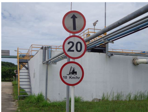
ภาพที่ 2-13 ป้ายจำกัดความเร็ว