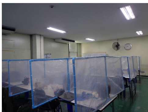
ภาพที่ 2-44 ห้องพักผ่อนติดตั้งเครื่องปรับอากาศ