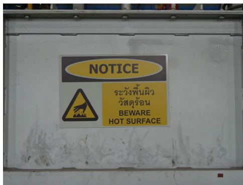
ภาพที่ 2-46 ป้ายเตือนบริเวณที่มีความเสี่ยง (ความร้อน)