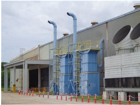
ภาพที่ 2-1 ระบบรวบรวมและดักฝุ่นแบบลูกกรง