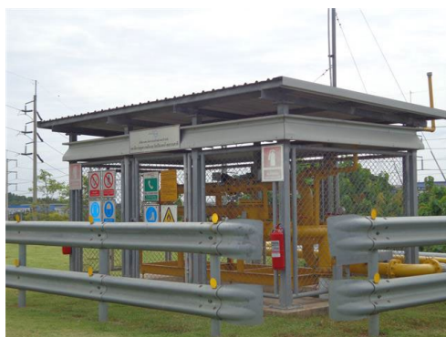
ภาพที่ 2-53 ป้ายเตือนบริเวณสถานีก๊าซธรรมชาติ