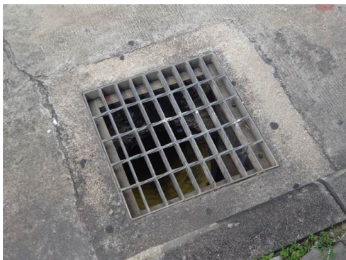
ภาพที่ 2-9 รางระบายน้ำฝน