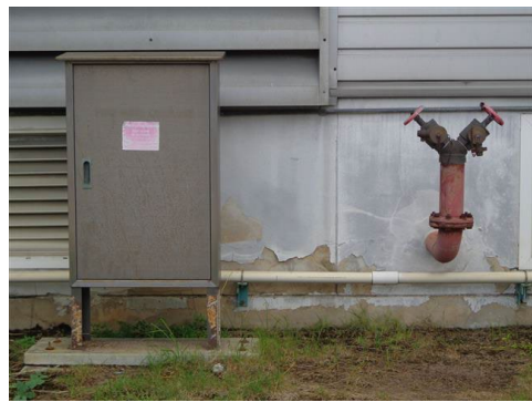
ภาพที่ 2-56 ระบบดับเพลิงภายในพื้นที่โครงการ