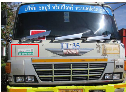
ภาพที่ 2-15 เบอร์ติดต่อร้องเรียนรถบรรทุกขนส่ง