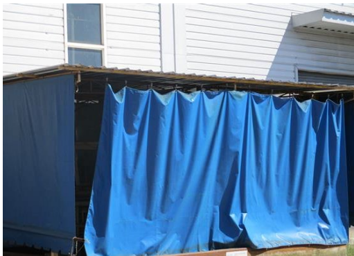
ภาพที่ 2-51 อาคารเก็บสารเคมี