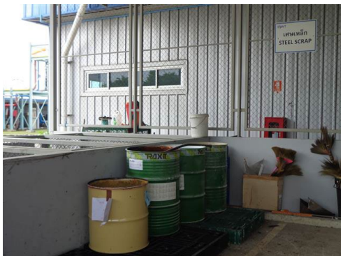
ภาพที่ 2-29 ชิ้นส่วนเหล็กจากการซ่อมบำรุง