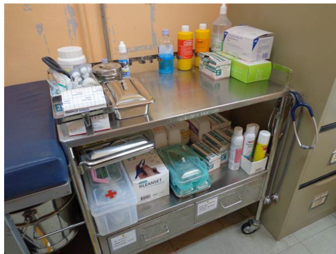
ภาพที่ 2-37 อุปกรณ์ปฐมพยาบาลเบื้องต้น