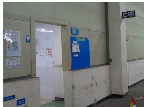
ภาพที่ 2-32 ห้องสุขาภายในพื้นที่ปฏิบัติงาน