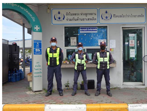
ภาพที่ 2-12 เจ้าหน้าที่รักษาความปลอดภัย