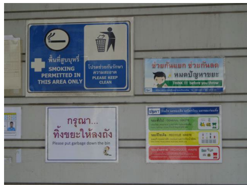
ภาพที่ 2-18 ป้ายรณรงค์การนำหลัก 3R มาประยุกต์ใช้ในการจัดการขยะ