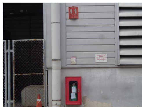
ภาพที่ 2-55 ถังดับเพลิง