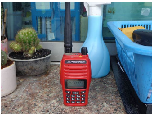
ภาพที่ 2-41 วิทยุสื่อสาร