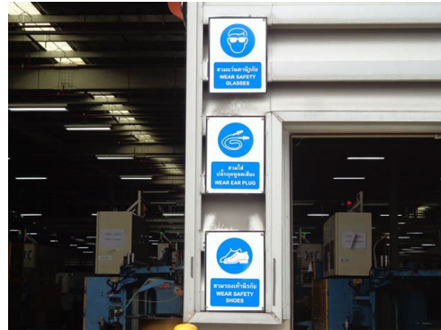
ภาพที่ 2-34 ป้ายเตือนบริเวณที่มีความเสี่ยง