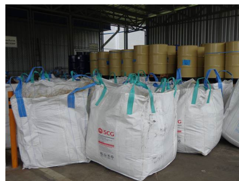
ภาพที่ 2-20 พื้นที่เก็บรวบรวมเศษขวดเหล็ก