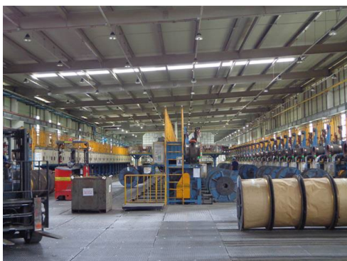
ภาพที่ 2-31 พื้นที่ปฏิบัติงาน