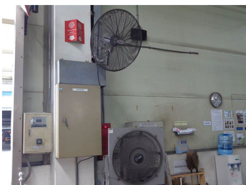
ภาพที่ 2-43 พัดลมระบายอากาศ