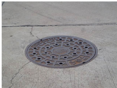
ภาพที่ 2-10 รางระบายน้ำเสีย