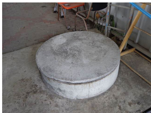
ภาพที่ 2-8 ถังดักไขมัน