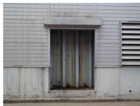
ภาพที่ 2-24 ถังรวบรวมสารหล่อลื่นเหลวเสื่อมสภาพ