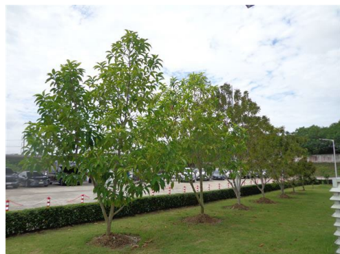
ภาพที่ 2-57 พื้นที่สีเขียว