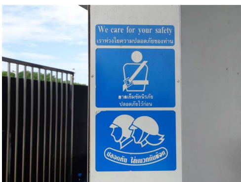
ภาพที่ 2-11 ป้ายรณรงค์สวมหมวกนิรภัย