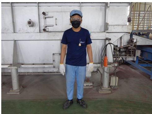
ภาพที่ 2-45 พนักงานสวมใส่อุปกรณ์ป้องกันความร้อน