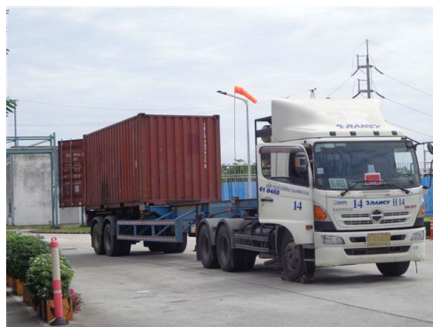
ภาพที่ 2-14 รถขนส่งปิดคลุมอย่างมิดชิด