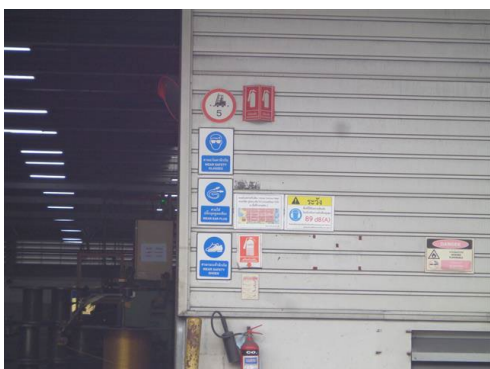
ภาพที่ 2-47 ป้ายเตือนบริเวณที่มีความเสี่ยง (เสียงดัง)