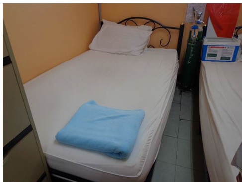
ภาพที่ 2-39 เตียงปฐมพยาบาล