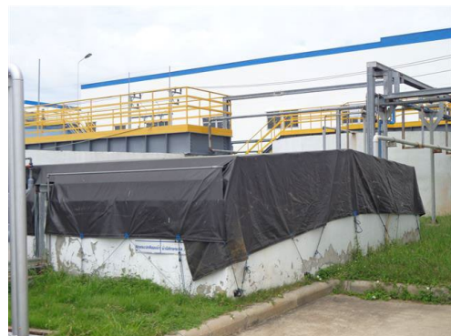
ภาพที่ 2-6 บ่อพักน้ำทิ้งสุดท้ายของโครงการ