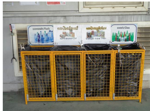
ภาพที่ 2-16 ถังขยะภายในพื้นที่โครงการ