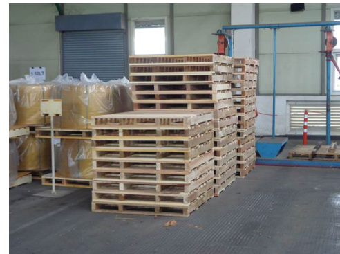
ภาพที่ 2-28 เศษชิ้นส่วนไม้ (ใช้รองวัตถุดิบ)